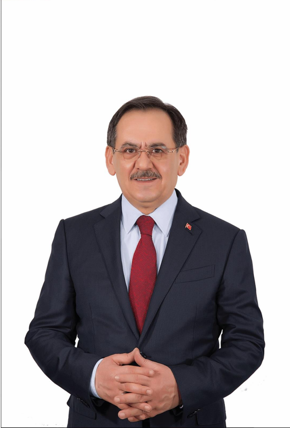
Mustafa DEMİR Samsun Büyükşehir Belediye Başkanı