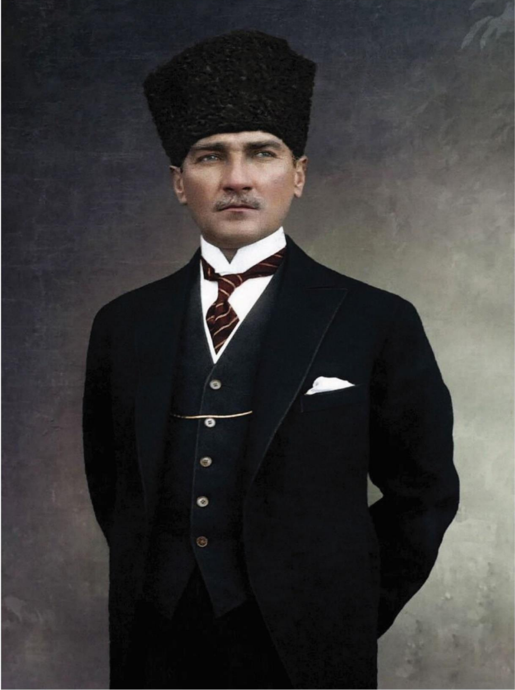
Mustafa Kemal ATARÜRK